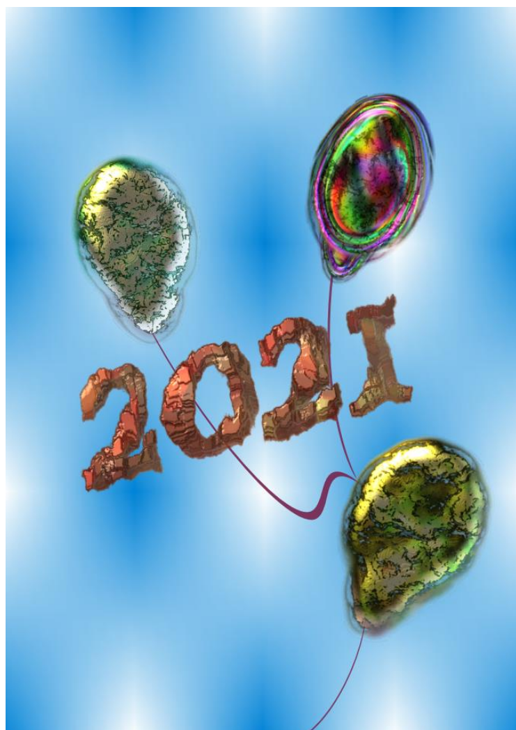
Grafika autorstwa Iwony W. z SZE

Agnieszka z SZE: Przed północą dołączyłam do spotkania. Każdy złożył sobie życzenia. Było bardzo sympatycznie. Po życzeniach poszłam spać.