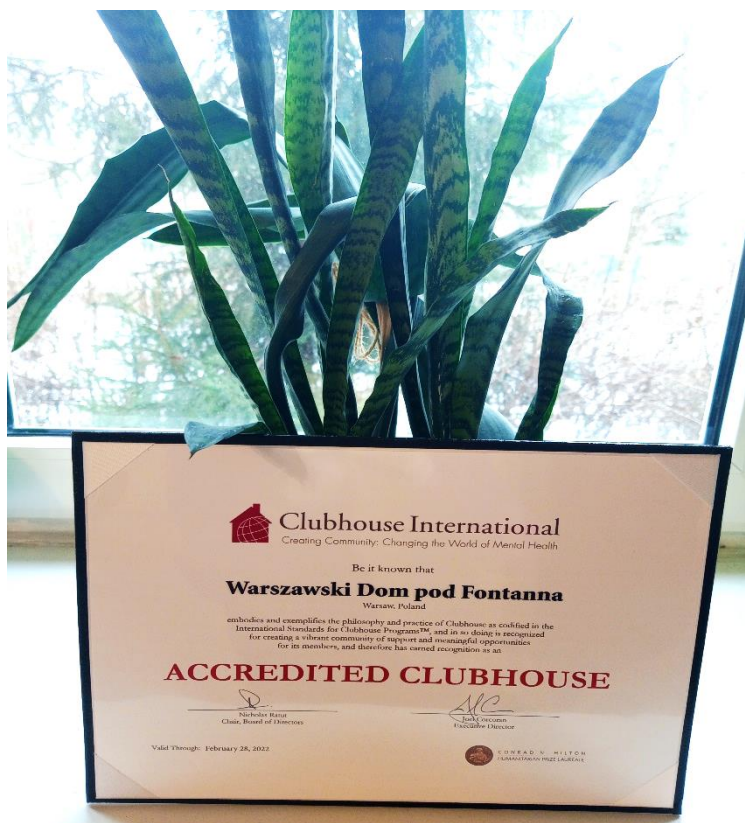
Zdjęcie certyfikatu akredytacji