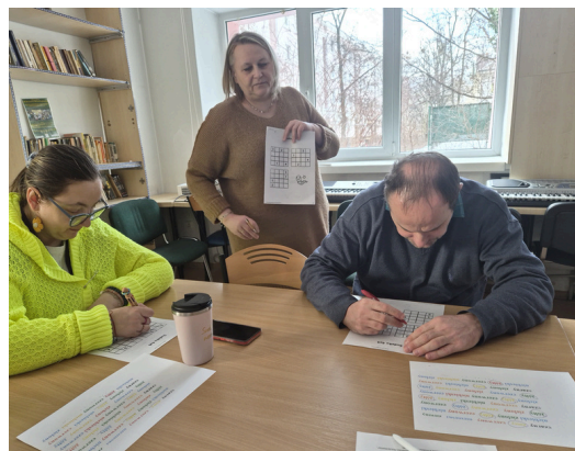
Ćwiczenie pamięci podczas warsztatów w sali EDU