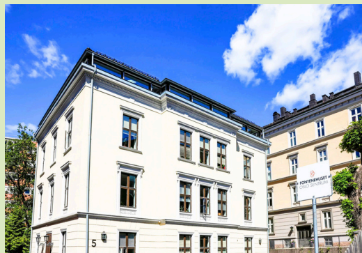
Siedziba Domu-Klubu w Oslo

Równolegle przekładamy na angielski nasze materiały, żeby móc opowiedzieć o nich tamtejszej społeczności. W tygodniowym harmonogramie Warszawskiego Domu pod Fontanną wygoszparowaliśmy czas na cotygodniowe spotkania, podczas których ustalamy nasze priorytety do przeanalizowania podczas treningu.