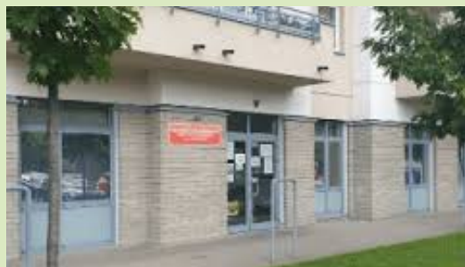
Miejsce Zatrudnienia Przejściowego OPS Białota